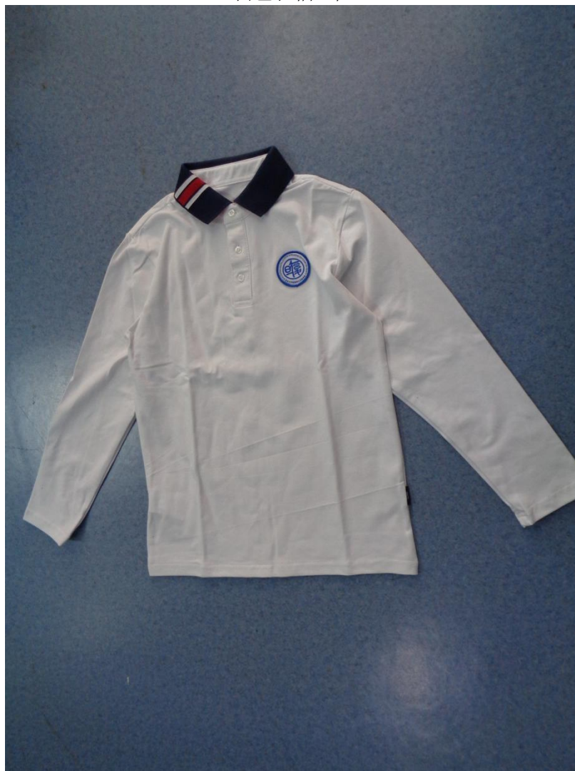
白色长袖 T 恤