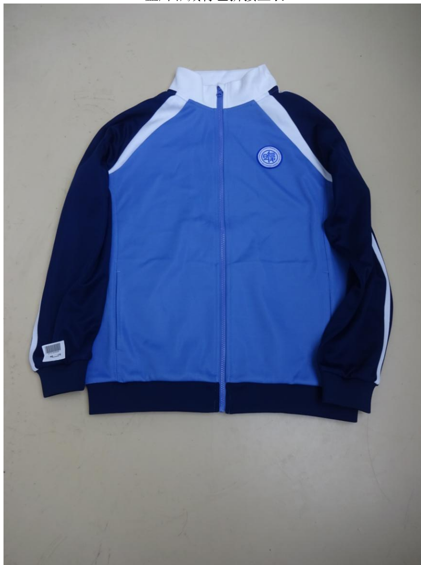
蓝/白/藏青色拼接上衣